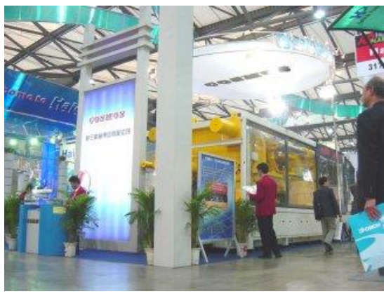
無錫格蘭機械集團公司的ブース全景 (COSMOS が格蘭社のブランド名)